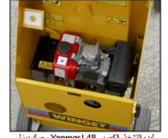
بدء تشغيل الكوريس Yanmar L48 محرك ديزل

الشاسيه: شاسيه بقسم صندوقي للخدمة الشاقة يوفر خطوطاً نظيفة و كميات أقل من المواد المحجوزة. يتم تركيبه مزوداً بنقاط رفع. الأسطوانة: مكونة من قطعتين، وتضمن الأسطوانة الفولاذية المستديرة مدة خدمة طويلة وسهولة عند الاستبدال. تصميم الأسطوانة عالي الفاعلية وتعمل شفرات التشغيل المزودة على ضمان الخلط الدقيق والتخلص من الانسداد و"تراكم" النفايات. خط الدفع: خط دفع للخدمة الشاقة مغلق بالكامل عبر سلسلة البكرة أو سير وسلسلة الدفع، بعجلة مائلة وترس مخروطي مصنوع من السبائك. الوصول: إمكانية وصول جيدة من جميع الجوانب إلى نقاط الفحص اليومي وعناصر الخدمة وكافة المكونات القابلة للاستبدال. التشغيل: يضمن التصميم الدقيق توفير أكبر مساحة عمل حول الماكينة للتحميل والخلط والتفريغ. المحاور / العجلات: يتم تزويد المحور الخلفي الثابت والمحور الأمامي المتراوح بعدد أربعة إطارات مطاطية بوسائد وقضيب جر في الطراز رباعي العجلات القياسي أو عدد ٢ إطار هوائي (مزودين بواقبات الوحل) وقضيب جر في طراز الجر السريع.