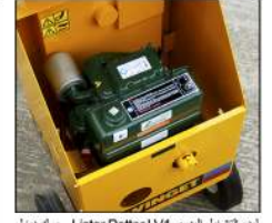
بدء تشغيل اليوبي Lister Petter LV1 محرك ديزل